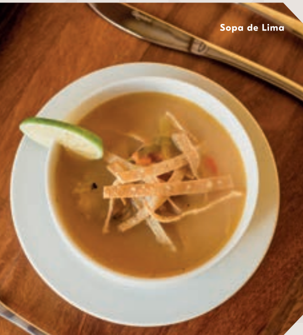
Sopa de Lima

La oferta culinaria de Yucatán es tan grande, que no sabrás por dónde empezar. Te recomendamos probar estos emblemáticos platillos: la cochinita pibil, la sopa de lima, los panuchos y salbutes, los papadzules, el relleno negro, las empanadas de chaya y queso de bola, el relleno blanco, el queso relleno, el brazo de reina, el pan de cazón, el tzic de venado y el pescado en Tikin-xic. Si tu visita es durante el periodo de la celebración a los Muertos o Hanal Pixán, podrás probar el delicioso mucbipollo o