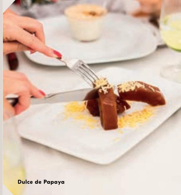
Dulce de Papaya