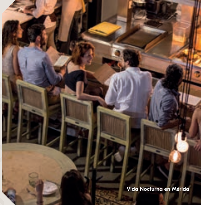
Vida Nocturna en Mérida

Al centro histórico de la ciudad también podrás llegar caminando, la noche sera el mejor momento para hacerlo y encontrarás un amplio programa de actividades culturales que ofrece el Ayuntamiento de la ciudad los 365 días del año; además de restaurantes, bares, museos, teatros y sitios de interés histórico para todos los gustos.