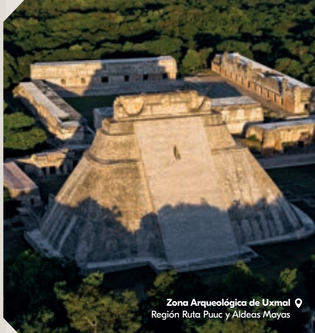
Zona Arqueológica de Uxmal Región Ruta Puuc y Aldeas Mayas