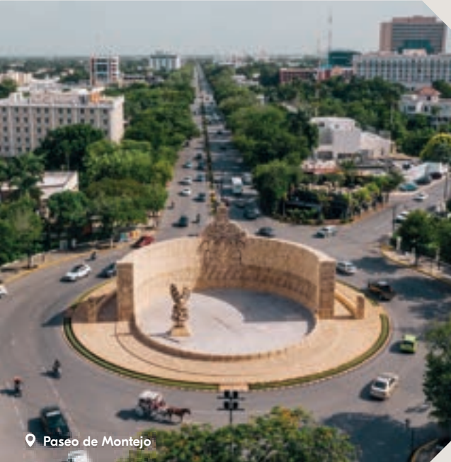
📍 Paseo de Montejo