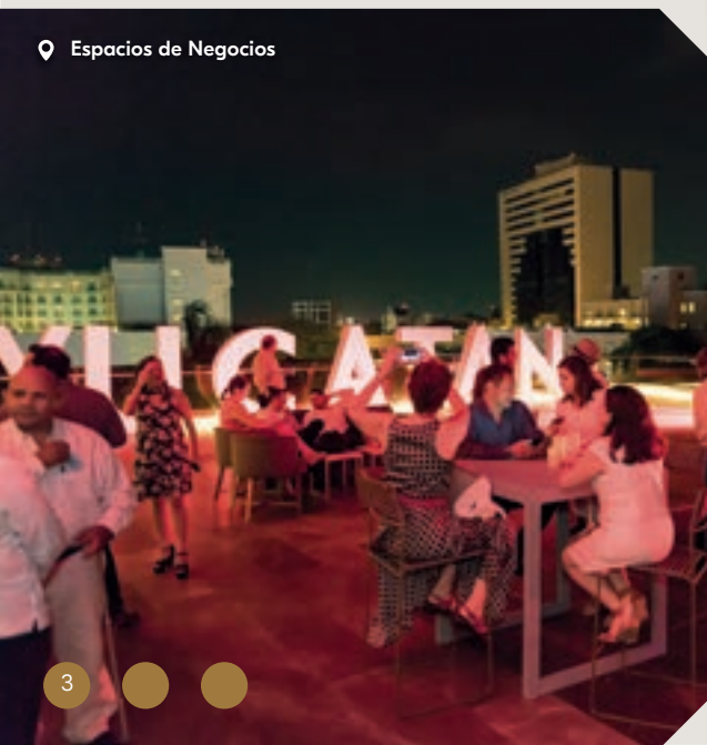
📍 Espacios de Negocios

Yucatán es un centro promotor del desarrollo regional en el sur de México. Pocos destinos reúnen tantas ventajas como Mérida, la capital del Estado. Con una inmejorable ubicación geográfica, excelente conectividad con el resto del país y destinos internacionales, una gran variedad de opciones recreativas y un abanico cultural que la han hecho acreedora en dos ocasiones al título de Capital Americana de la Cultura en adición a ser una de las ciudades “Más Amigables del Mundo” y la “Mejor Ciudad Pequeña del Mundo” de acuerdo a Condé Nast Traveler 2019.